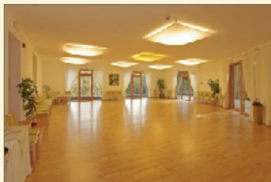
140 qm Tanzsaal

Frühbucherrabatt bis 24.12.2020: CHF 20.- pro Kursteilnehmer